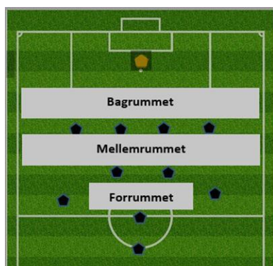
Definition af forrum, mellemrum og bagrum. Spillerne på illustrationen er modstanderen.

I forhold til spillestilen er det relevant at præsentere følgende begrebsafklaringer: