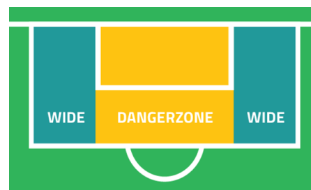
Definition af dangerzone (orange).